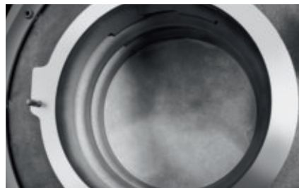
Wirtschaftlichkeit im Detail: der robuste Wärmetauscher aus Aluminium-Guss.

Der Logano plus GB212 arbeitet zuverlässig und wartungsarm. Durch den einfachen Front-Service lassen sich notwendige Arbeiten aber auch hier schnell und kostengünstiger erledigen!